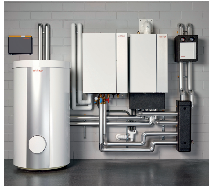
Hybridanlagen (zum Beispiel ein Gas-Brennwertgerät kombiniert mit einer Splitwärmepumpe) werden vom Bund gefördert. Mehr Infos dazu finden Sie auf: weishaupt.de/foerderung

Während ein Neubau oder ein Bestandsgebäude mit Fußbodenheizung ideal für die alleinige Beheizung mit einer Wärmepumpe geeignet ist, bietet die Kombination eines Weishaupt Gas-Brennwertgerätes mit einer Weishaupt Wärmepumpe den Vorteil, auch ohne Flächenheizungen den Großteil der Jahresheizarbeit über die Wärmepumpe äußerst wirtschaftlich abzudecken. Bei extrem niedrigen Außentemperaturen oder für die Wassererwärmung übernimmt automatisch das Gas-Brennwertgerät die Wärmeproduktion.